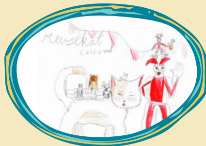
Youssra Mourabit (9 jaar)