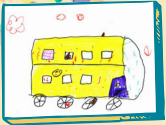
Gigi Jochems (10 jaar)