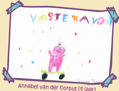
Anhabel van der Corput (9 jaar)