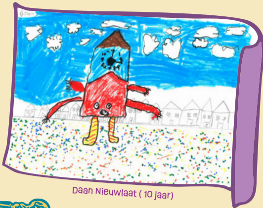
Daan Nieuwlaat (10 jaar)