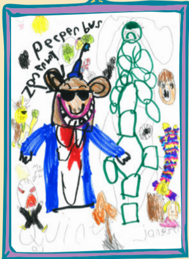
Quinten Janssen (9 jaar)