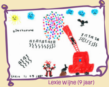
Lexie Wijne (9 jaar)