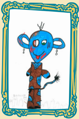
Devin Reuvers (11 jaar)