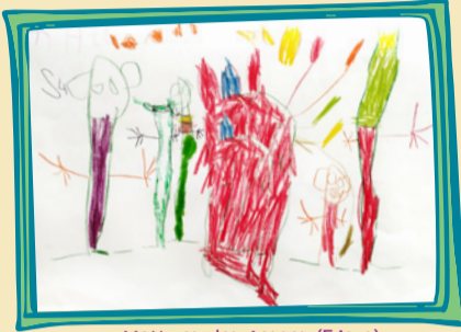
Matt van den Aarsen (5 jaar)