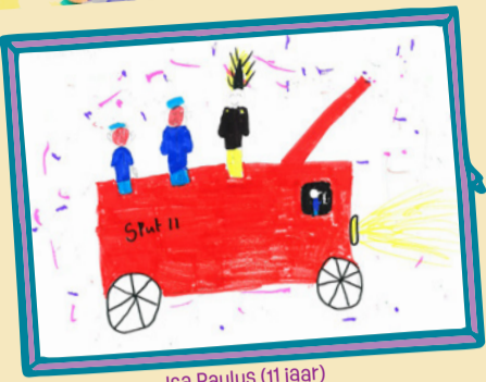
Isa Paulus (11 jaar)